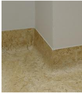
sokl (barva dle podlahy)