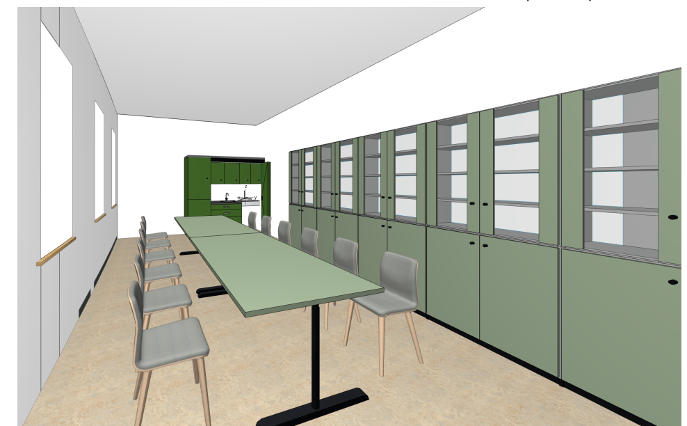
ilustrační zobrazení místnosti domácí hospicové péče (2.14)

Před zahájením výroby, objednááním, nebo zabudováním PSV. budou na stavbě ověřeny stavební rozměry, způsob zabudování a stavební návaznosti a barevné řešení. Součástí dodávky výrobků bude i dílenská dokumentace výrobků PSV. Dílenská dokumentace bude předložena k odsouhlasení investorem a architektem stavby. Veškeré výrobky, pohledové materiály, spoje, styky atd. budou na stavbě vyzvorkovány a odsouhlaseny autorem návrhu. Nedílnou součástí projektové dokumentace je D.1.1a - Technická zpráva a D.1.3 - Požárně bezpečnostní řešení i jiné související části projektové dokumentace.