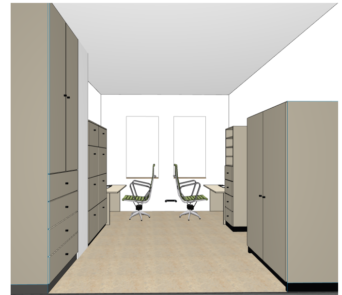
ilustrační zobrazení místnosti kanceláře domácí hospicové péče (2.13)